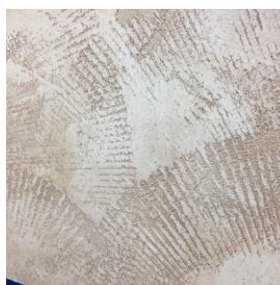
キャタピラー型ローラーで特徴的なスクラッチもできます。