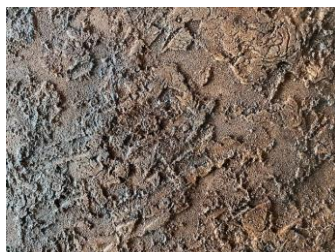
←メタルワックス塗布

◎保護材の併用おすすめです。内装はナチュラルワックス、メタルワックスからお選びください。